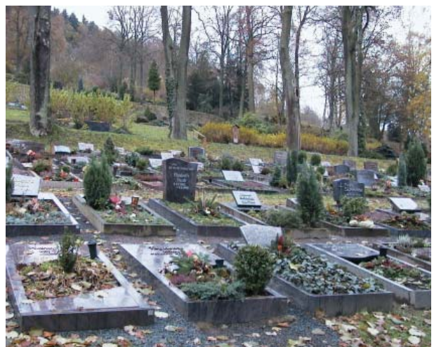
Ein übliches Reihengrab muss auf jeden Fall vom Sozialamt bezahlt werden - egal ob für Sarg oder Urne.

Der Träger der Sozialhilfe muss nicht nur für die Kosten einer Erdbestattung aufkommen, sondern auch für eine Feuerbestattung (Einäscherung) inklusive einer einfachen Schmuckurne. In der Regel werden die Kosten einer Beisetzung in einer Reihengrabstätte (Grabstätten für Sarg- und Urnenbeisetzungen) übernommen. Eine